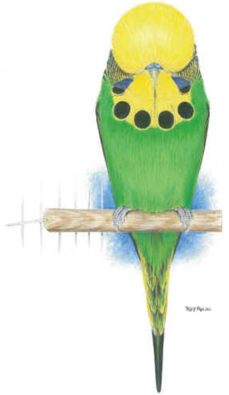
The Official WBO Pictorial Ideal